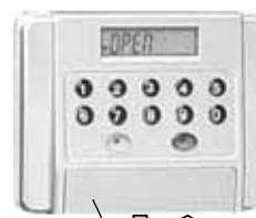
kulcslyukat takaró fedél

A széfet ne telepítse nedves környezetbe (pl. fürdőszobába, borospincébe), mert az elektronikát súlyos károsodás érheti. Az ebből eredő meghibásodásért felelősséget nem vállalunk. Ilyen esetben a garancia is érvényét veszti!